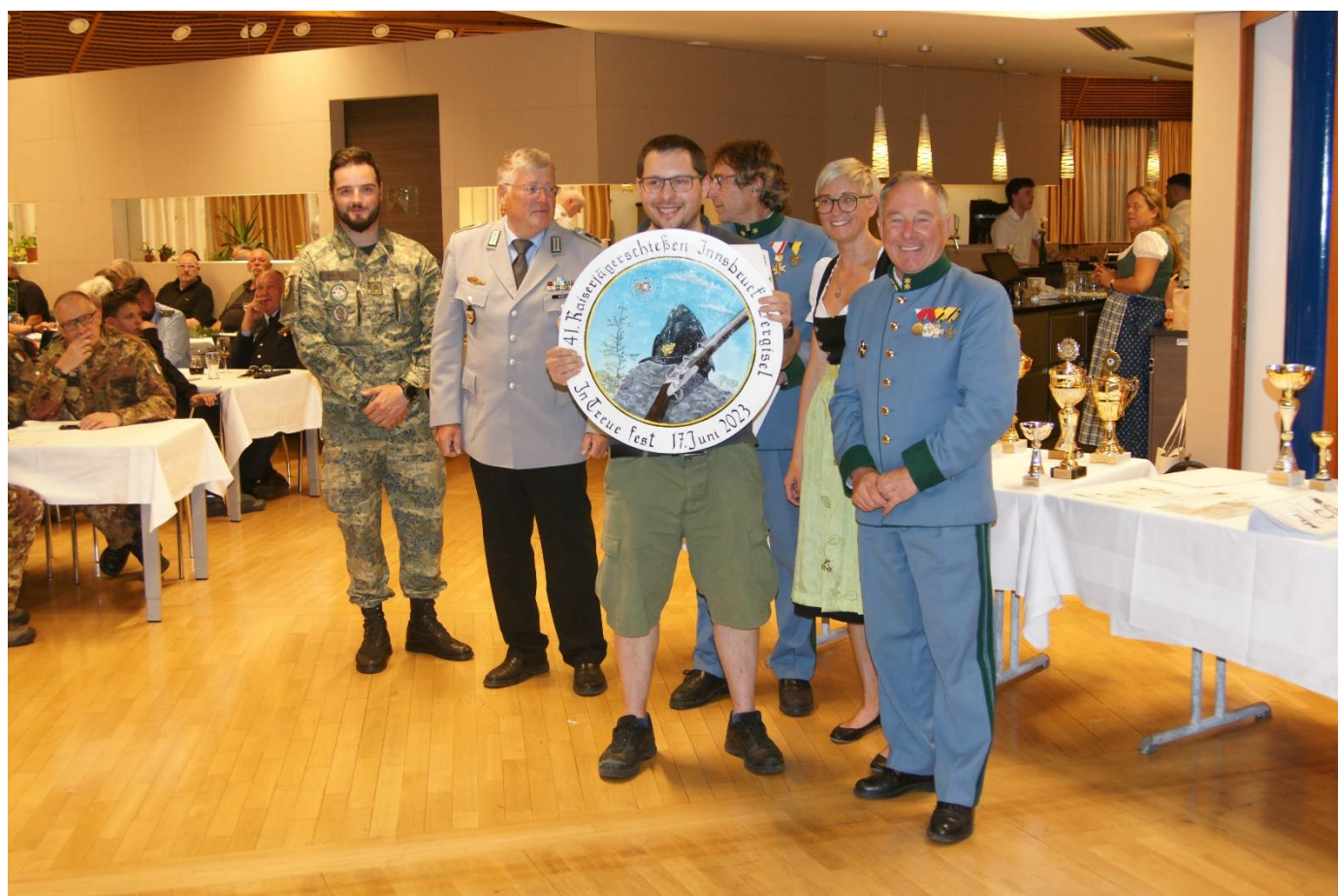
Übergabe der Ehrenscheibe dem besten Schützen mit 95 Ringen

Am Abend durften wir dann die Preisverteilung im Casino des Militärkommandos Tirol durchführen. Für Speis und Trank war bestens gesorgt und somit konnten die Ehrenpreise übergeben werden.