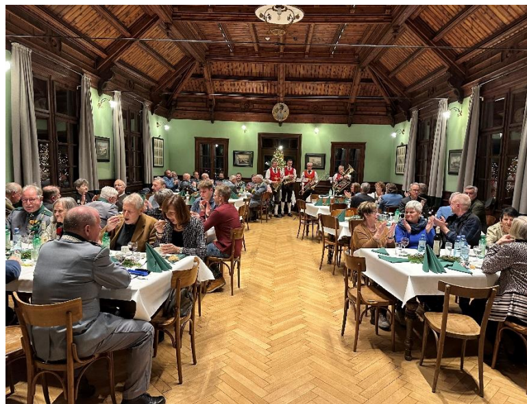
Festsaal im Urichhaus