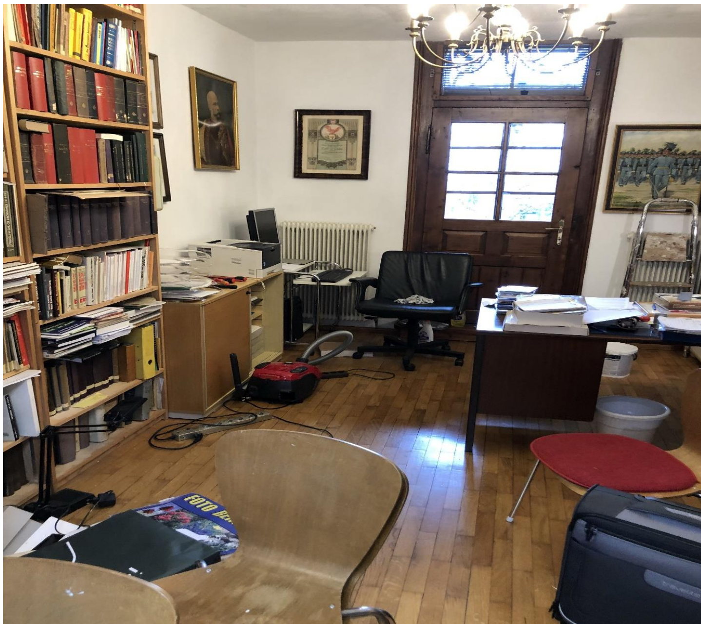
Büro in Arbeit

Am 06.02.2023 hielt unser neuer Obmann seinen 1. Vereinsabend ab. Es wurde beschlossen, dass die EDV Anlage erneuert werden muss und das Vereinsheim neu ausgemalen wird.