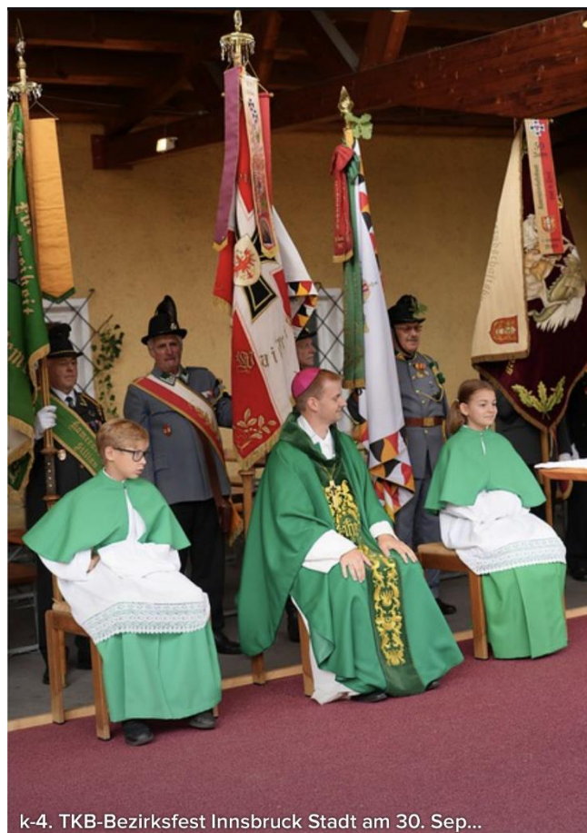
k-4. TKB-Bezirksfest Innsbruck Stadt am 30. Sep...