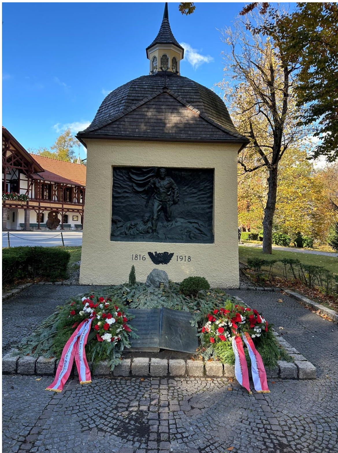
Niedergelegte Kränze bei der Kreuzkapelle

Am 02.11.2023 lud uns das Land Tirol und das Österreichische Bundesheer zur Allerseelen-Gedächtnisfeier am Bergisel ein. Wir stellten 2 Gewehrträger und eine Fahnenabordnung. Am Ende der Veranstaltung gemütliches Beisammensein im Urichhaus.