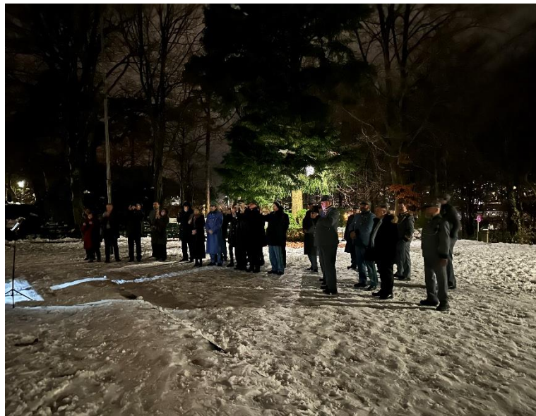
vor dem Andreas Hoferdenkmal