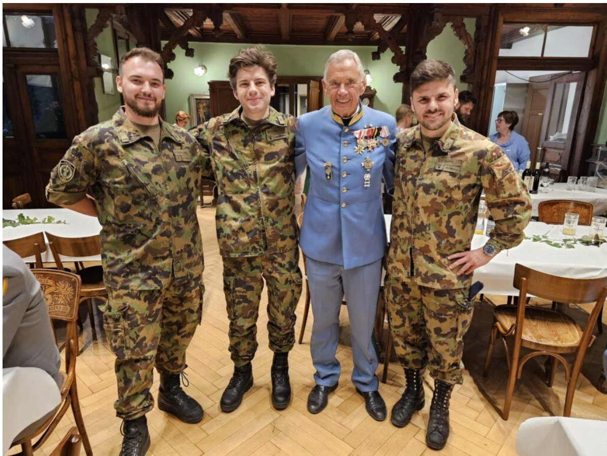
Überaus nette Offiziere aus March-Höfe.( CH) Zum erstenmal beim Kaiserjägerschiessen dabei.